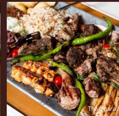
The Izgara II