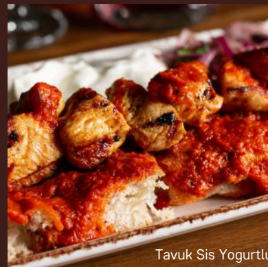
Tavuk Sis Yogurtlu