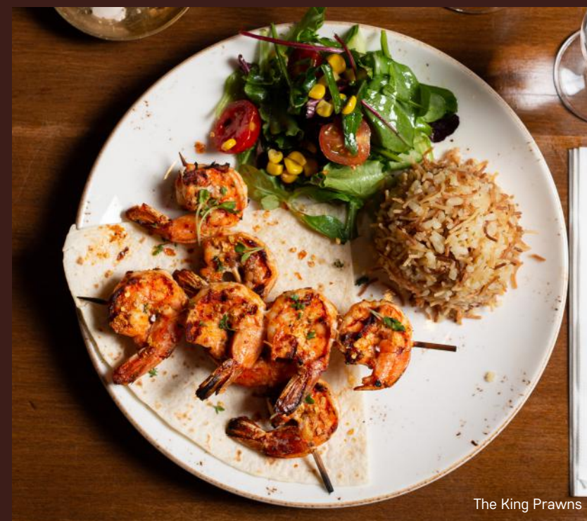
The King Prawns