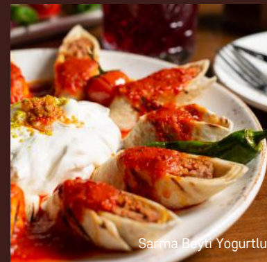
Sarma Beyti Yogurtlu