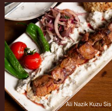
Ali Nazik Kuzu Sis